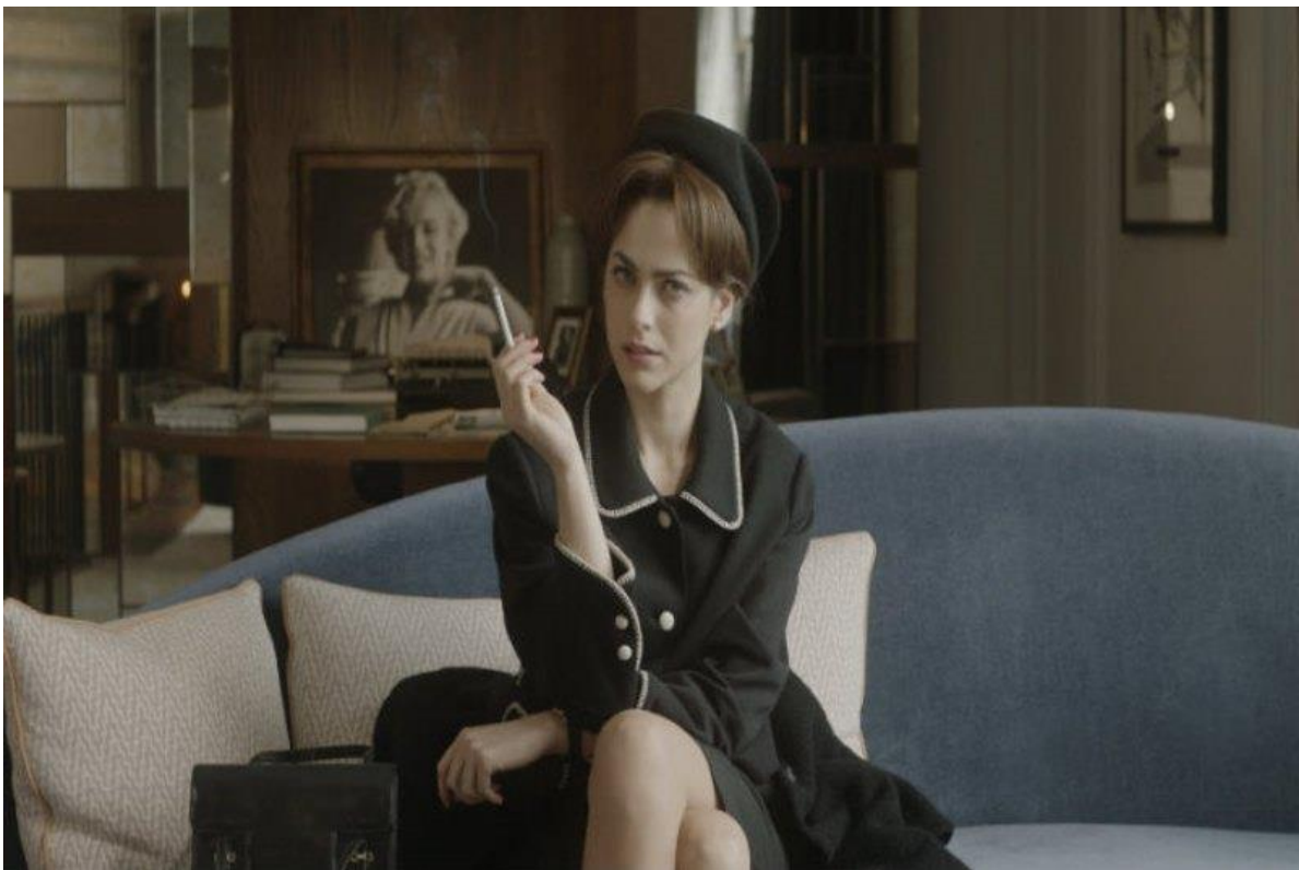
A Cup of Coffee With Marilyn