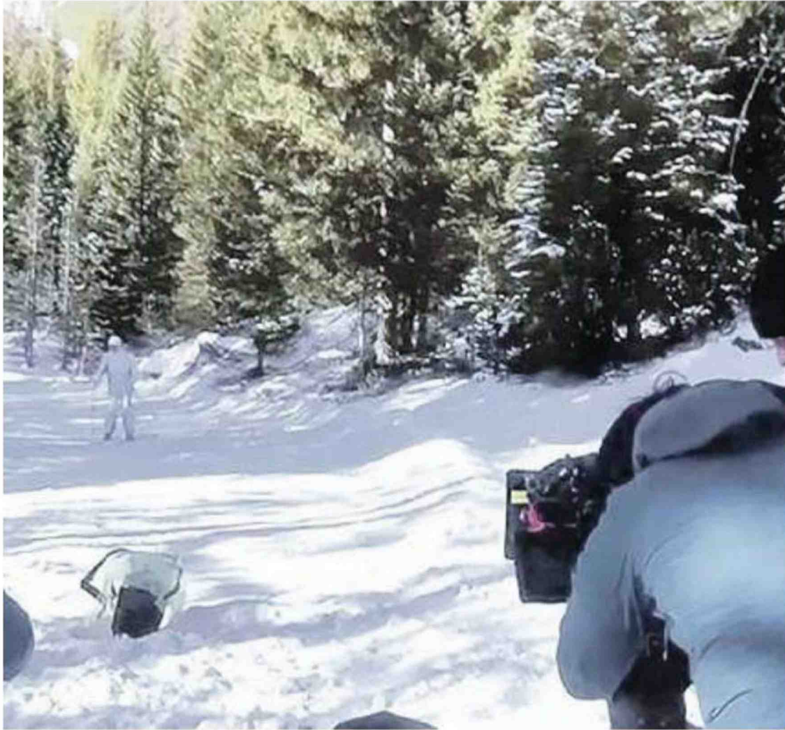
CIAK Alcune scene del film "The new pope" di Paolo Sorrentino girate in Ampezzo

00064145 | IP ADDRESS: 37.187.188.107 stoglia.ilgazzettino.it