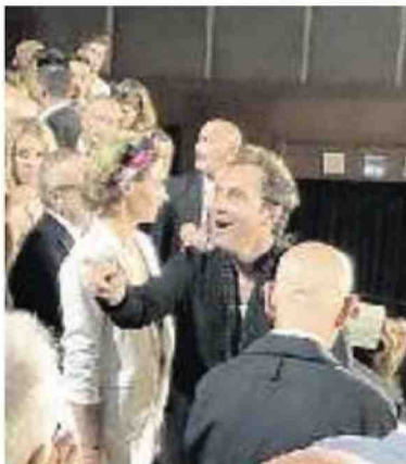
ATTORE Jude Law a Venezia