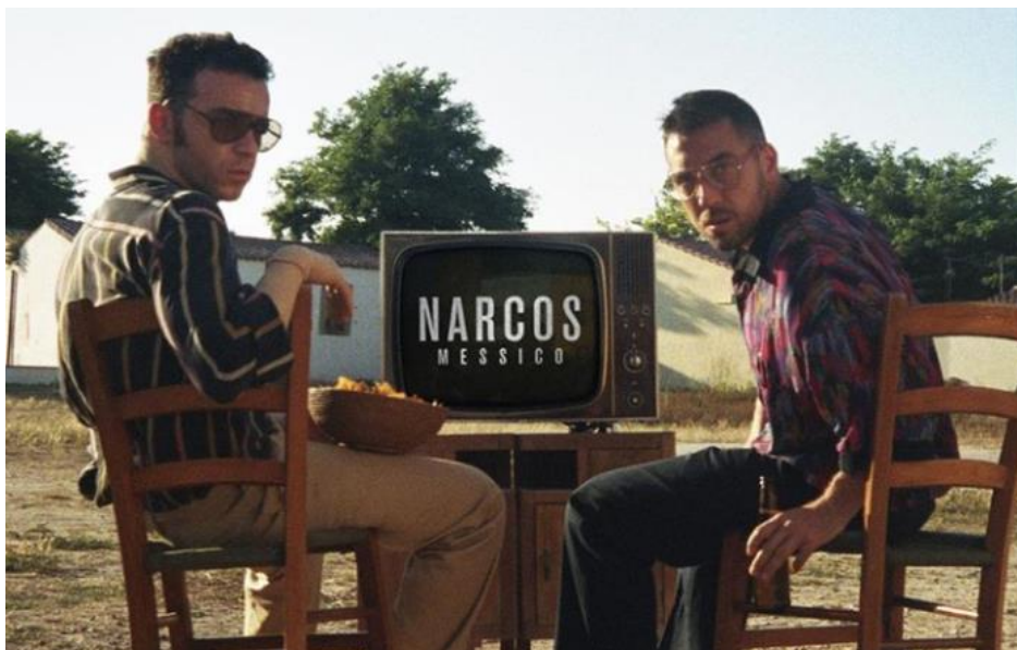
Sparare alla Luna di Salmo – regia di YouNuts!