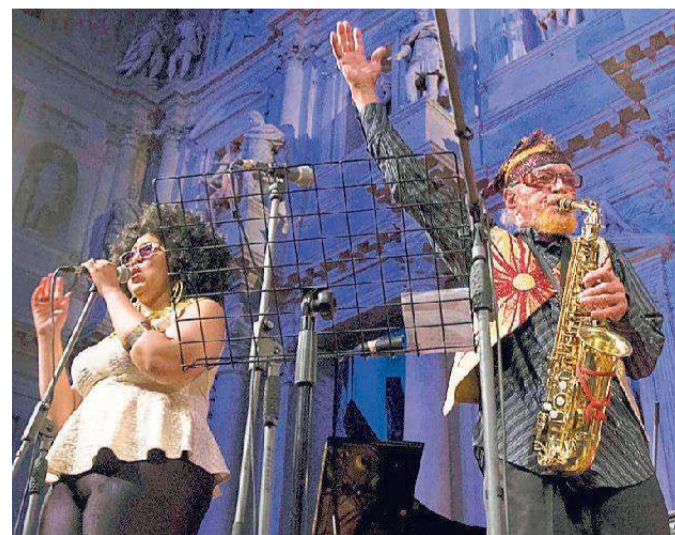
The Sun Ra Mythic Dream Arkestra

L'edizione 2018 del festival sarà dedicata a "The Birth of Youth", una celebrazione del cinquantesimo anniversario del 1968, l'anno delle rivolte giovanili. La data storica per le lotte a favore dei diritti civili, il pacifismo, la controcultura e il desiderio di cambiamento, sarà celebrata con musicisti che sono stati protagonisti di quel periodo e jazzisti giovani che vogliono proporre di loro modo una nuova stagione di cambiamenti. Camille Bertault, famosa per la sua rilettura del solo di "Giant Steps" di John Coltrane, sarà protagonista del prologo della rassegna il 10 all'Auditorium Fonato di Thiene e dell'inizio ufficiale, l'11, al Jazz Café Trivellato. La leggendaria Sun Ra Mythic Dream Arkestra, a Vicenza per produrre un film musicale, si esibirà sotto la direzione di Marshall Allen, 93 anni, al Teatro Olimpico l'11 alle 21 e il 12 alle 18. Musicisti e danzatori nei loro coloratissimi abiti afro-futuristi spazieranno dalla