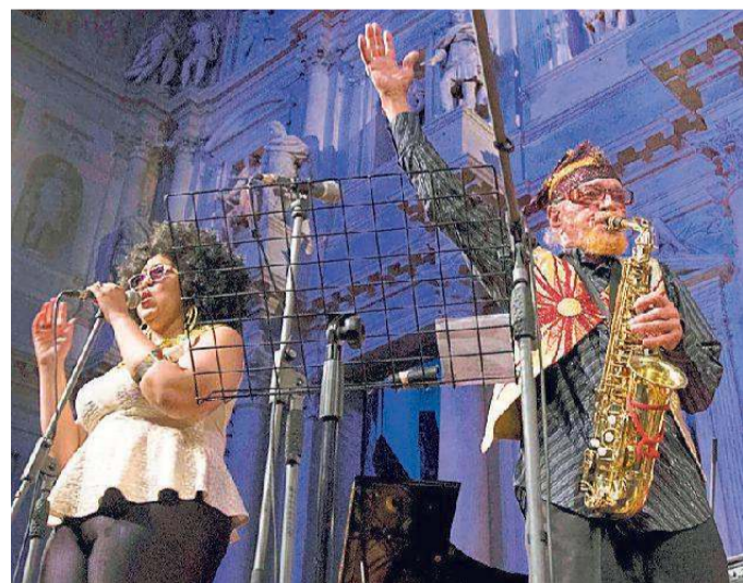
The Sun Ra Mythic Dream Arkestra

L'edizione 2018 del festival sarà dedicata a "The Birth of Youth", una celebrazione del cinquantesimo anniversario del 1968, l'anno delle rivolte giovanili. La data storica per le lotte a favore dei diritti civili, il pacifismo, la controcultura e il desiderio di cambiamento, sarà celebrata con musicisti che sono stati protagonisti di quel periodo e jazzisti giovani che vogliono proporre di loro modo una nuova stagione di cambiamenti. Camille Bertault, famosa per la sua rilettura del solo di "Giant Steps" di John Coltrane, sarà protagonista del prologo della rassegna il 10 all'Auditorium Fonato di Thiene e dell'inizio ufficiale, l'11, al Jazz Café Trivellato. La leggendaria Sun Ra Mythic Dream Arkestra, a Vicenza per produrre un film musicale, si esibirà sotto la direzione di Marshall Allen, 93 anni, al Teatro Olimpico l'11 alle 21 e il 12 alle 18. Musicisti e danzatori nei loro coloratissimi abiti afro-futuristi spazieranno dalla