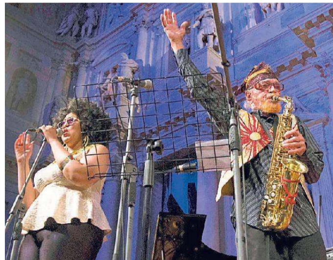
The Sun Ra Mythic Dream Arkestra

L'edizione 2018 del festival sarà dedicata a "The Birth of Youth", una celebrazione del cinquantesimo anniversario del 1968, l'anno delle rivolte giovanili. La data storica per le lotte a favore dei diritti civili, il pacifismo, la controcultura e il desiderio di cambiamento, sarà celebrata con musicisti che sono stati protagonisti di quel periodo e jazzisti giovani che vogliono proporre di loro modo una nuova stagione di cambiamenti. Camille Bertault, famosa per la sua rilettura del solo di "Giant Steps" di John Coltrane, sarà protagonista del prologo della rassegna il 10 all'Auditorium Fonato di Thiene e dell'inizio ufficiale, l'11, al Jazz Café Trivellato. La leggendaria Sun Ra Mythic Dream Arkestra, a Vicenza per produrre un film musicale, si esibirà sotto la direzione di Marshall Allen, 93 anni, al Teatro Olimpico l'11 alle 21 e il 12 alle 18. Musicisti e danzatori nei loro coloratissimi abiti afro-futuristi spazieranno dalla