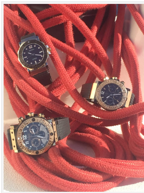
Tre versioni del Plongeur di Paul Picot